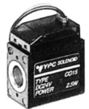
SD1-**- IP42 Indicator : LED